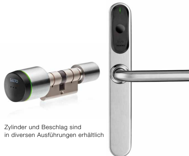
Zylinder und Beschlag sind in diversen Ausführungen erhältlich

Die batteriebetriebenen elektronischen Zylinder sind äußerst kompakt und durch den einfachen Austausch des Türzylinders schnell montiert. Ideal auch für Objekte, in denen es nicht möglich oder gewünscht ist, Türbeschläge anzubringen (z. B. Denkmalschutz). Für innen wie außen geeignet und mit verschiedenen Oberflächen erhältlich.