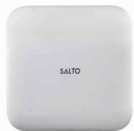
IQ und Repeater mit identischer Größe und Optik

Der IQ verbindet als Hub die Zylinder und Beschläge mit der Online-Plattform SALTOKS.COM – und das komplett kabellos. Einfach den IQ mit der Halterung an der Wand befestigen, Strom anschließen und im geschützten persönlichen SALTO KS Account aktivieren. Der IQ verbindet sich über M2M-Mobilfunk oder das IT-Netzwerk mit der Online-Plattform. Die Entfernung zu den Zylindern und Beschlägen sollte maximal 10 Meter betragen.