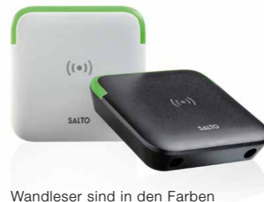
Wandleser sind in den Farben Weiß und Schwarz erhältlich

Die Wandleser beziehen all jene Türen in die Zutrittslösung ein, an denen kein Zylinder oder Beschlag angebracht werden kann, z. B. automatische Türsysteme, Schranken oder Aufzüge etc. Für den Innen- und Außeneinsatz geeignet. Als einzige SALTO KS Komponente benötigen die Wandleser zum Ansteuern der Türen eine Verkabelung.